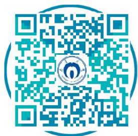
南华大学招生就业云服务平台

第四步：会议开始前我校将通过“云校招企业服务平台”微信公众号向审核通过的参会单位统一发送参会意向确认通知，请在微信上及时确认回复，选择“ 确认要参加 ”和“ 确认不参加 ”，以便我校及时作出安排调整。