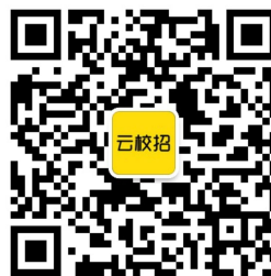
云校招企业服务平台